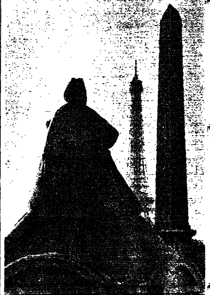
في ٢٦ كانون الثاني اجري، وجزءه من الاحتفالات الثورية الثانية للثورة الفرنسية يقوم جاك شيراك، عمدة باريس، بإضاءة الستار عن تمثال في ساحة الكونكورد يجري حاليا ترميمه. وتبدو في الصورة عملية الترميم الى جانب سلة سلة الكونكورد وبرج ايفل.